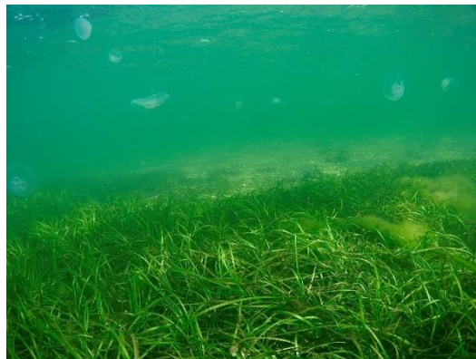
Abbildung 1: Seegraswiesenbestand.

In Tiefen zwischen 0,5 und 6 Metern fühlt sich die Pflanze besonders wohl, denn für die lebensnotwendige Photosynthese ist das Sonnenlicht, das in deutschen Gewässern bis zu diesen Tiefen verfügbar ist, unverzichtbar. Vereinzelt sind auch Bestände in elf Metern Tiefe, wie zum Beispiel in der Ostsee vor der Insel Hiddensee, zu verzeichnen. Grund dafür ist die lokale Wasserqualität: das Sonnenlicht dringt hier tiefer als in andere Bereiche unserer Hausmeere vor. Sind die Pflanzen in ihrem Vorkommen in der Tiefe durch das Sonnenlicht begrenzt, so liegt dies im Flachwasserbereich an der Wasserbewegung (Wellenexposition) sowie an Eisgang. An wellenexponierten Küsten wächst Seegras nur in größeren Tiefen, in die noch Sonnenlicht durchdringt.