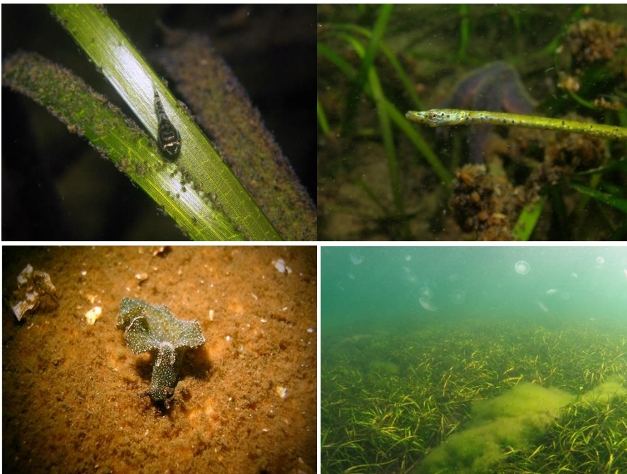
Abbildung 2: Juveniler Seehase auf einem Seegrasblatt (oben links), Kleine Seenadel im Seegras (oben rechts), Grüne Samtschnecke am Meeresboden (unten links), Seegraswiese im Sonnenlicht (unten rechts).

Seegraswiesen bieten vielen Tieren einen wichtigen Rückzugsort und Lebensraum. Viele Arten, wie zum Beispiel der Hering oder verschiedene Schnecken, nutzen die dichten Wiesen zur Eiablage und Jungfischen dienen sie als Kinderstube. Dort wo das Gras dicht wächst, sind sie nicht nur vor Fressfeinden, sondern auch vor dem Wegtreiben gut geschützt, da die langen Blätter des Seegrases den Wellengang abschwächen. Kleine Wattschnecken bedienen sich an den auf den Seegrasblättern wachsenden Algen und tragen damit zum gesunden Wachstum der Unterwasserwiesen bei. Grasnadeln sind Fische, die wie der Name andeutet, vom Seegras als Lebensraum profitieren und dort besonders oft anzutreffen sind. Durch ihren langen, schmalen Körperbau sind sie senkrecht schwimmend im dichten Seegras kaum mehr von einem Blatt zu unterscheiden. Damit sind sie vor Fressfeinden, sowie für die Jagd bestens getarnt. Die Pflanzen geben Sauerstoff in das Wasser ab und bieten einen attraktiven Lebensraum für am Meeresboden lebende Tiere wie Würmer, Krebse, Muscheln und Seeigel. Auch meeresaffine Tiere wie Ringelgänse und Pfeifenten profitieren von diesem besonderen Lebensraum, indem sie ihn als direkte Nahrungsquelle nutzen.