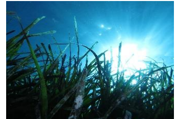
Abbildung 1: Das am weitesten verbreitete Seegras im Mittelmeer ist das Neptungras ( Posidonia oceanica ). Von Kroatien über Italien bis hin nach Spanien kann diese Pflanze in Form von weiten, grünen Unterwasserswiesen oder als wohlriechende, aus dem Meer angespülte Seegrasbälle bestaunt werden. Eine Erbgut-Analyse des Neptungrases des gesamten Mittelmeers hat eine weite Verbreitung (bis zu 15 km) ihrer Klone ergeben. Basierend auf weiteren Erkenntnissen ordnen die Forschenden dem Neptungras des Mittelmeers ein Alter von bis zu 80.000 Jahren zu. Damit würde es sich um die ältesten Lebewesen der Erde handeln.