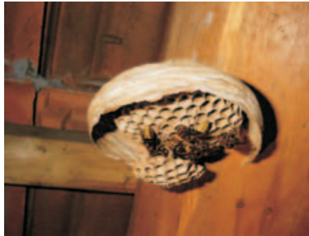
Ein Hornissennest im frühen Stadium.

Durch die Hilfe der ständig steigenden Zahl von Arbeiterinnen wächst das Nest schnell an. Sie bauen neue Waben und erweitern die alten kontinuierlich.